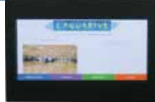
Affichage électronique des plannings devant les salles